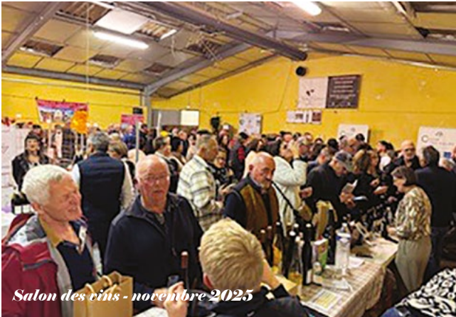
Salon des vins - novembre 2025