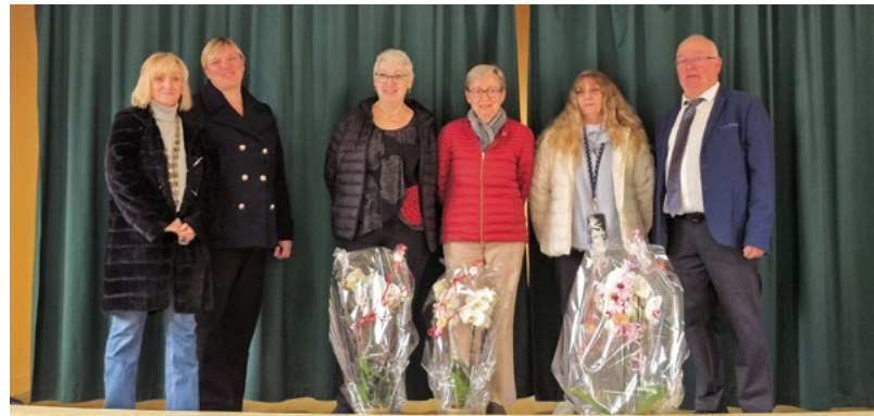
Remise des prix Maisons fleuries