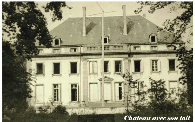
Château avec son toit