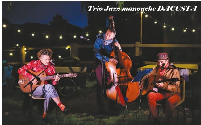
Trio Jazz manouche D.ACUST.1

Institution pour la sauvegarde et la promotion des lapins de race SUJET REMARQUABLE Grand Prix d'Exposition Exposition partenaire de la course aux œufs BONDS 50PTS