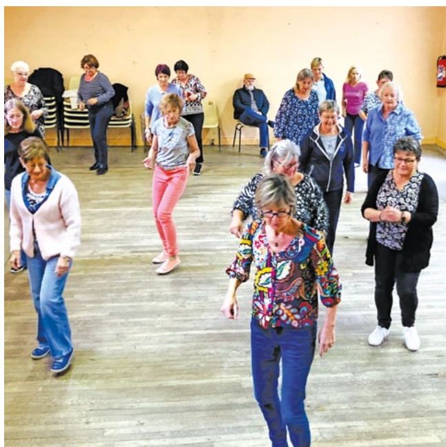
Initiation au madison