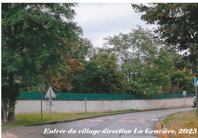
Entrée du village direction La Gravière, 2025