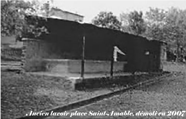
Ancien lavoir place Saint-Amable, démoli en 2007