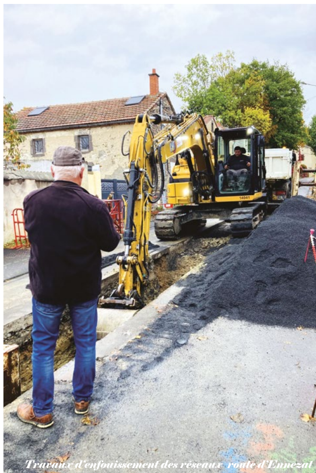
Travaux d'enfouissement des réseaux : route d'Ennezat