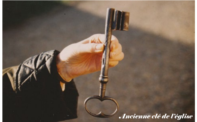
Ancienne clé de l'église