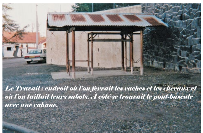
Le Travail : endroit où l'on ferrait les vaches et les chevaux et où l'on taillait leurs sabots. À côté se trouvait le pont-bascule avec une cabane.