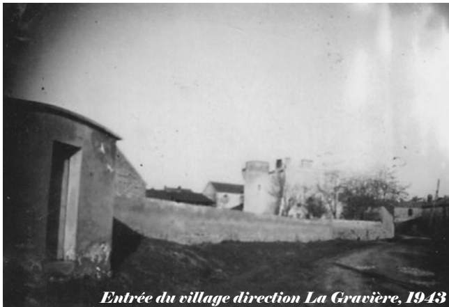
Entrée du village direction La Gravière, 1943