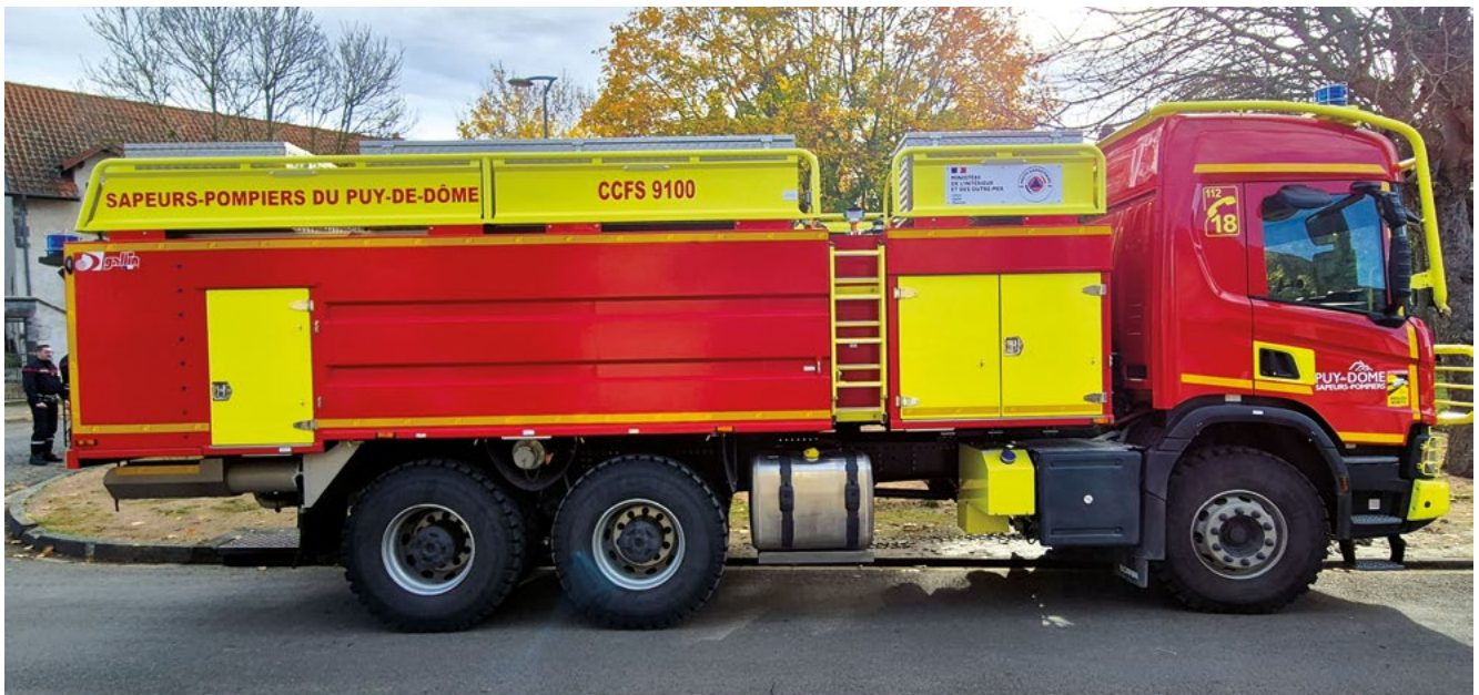
Camion pompier CCFS 9100

Des sapeurs-pompiers de la caserne d'Ennezat, des formateurs conduite ainsi qu'un mécanicien du SDIS sont formés sur le véhicule.