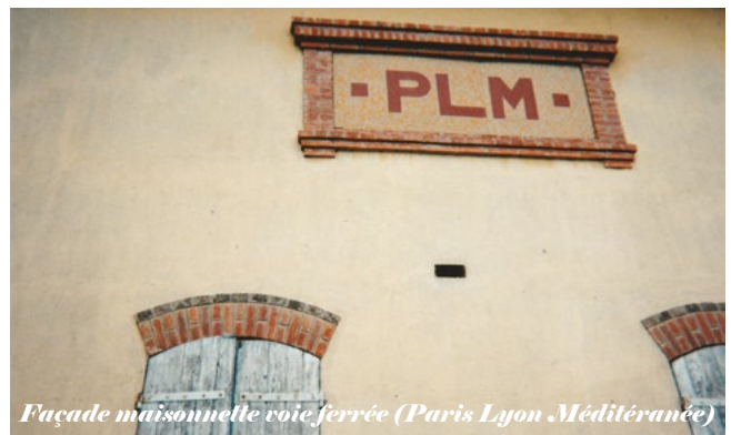
Façade maisonnelle voie ferrée (Paris Lyon Méditerranée)