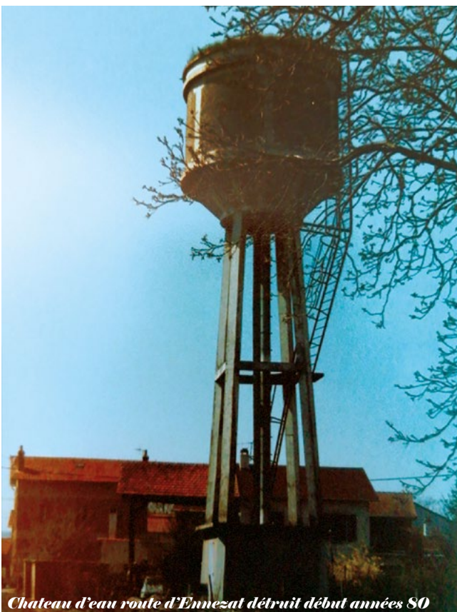
Chateau d'eau route d'Ennezat détruit début années 80