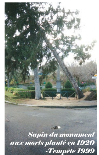
Sapin du monument aux morts planté en 1920 -Tempête 1999