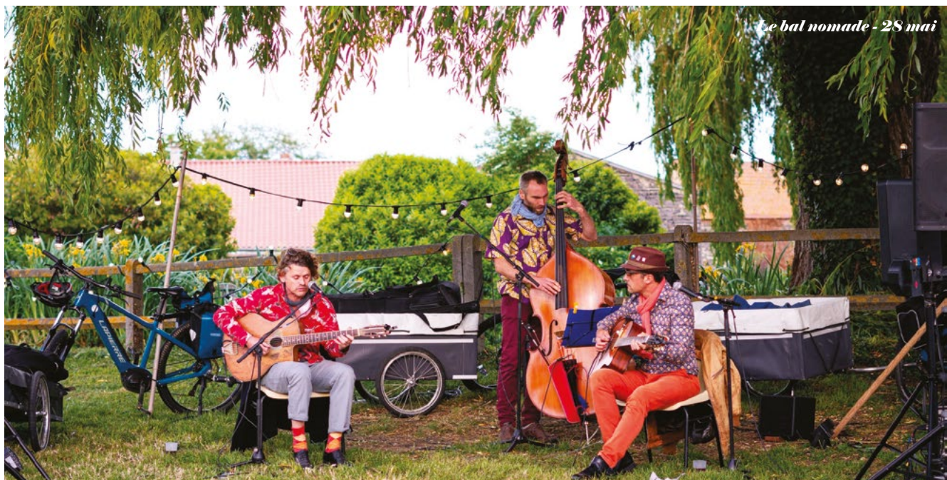
Le bal nomade - 28 mai