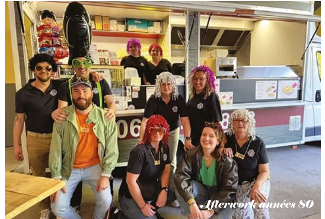
Afterwork années 80