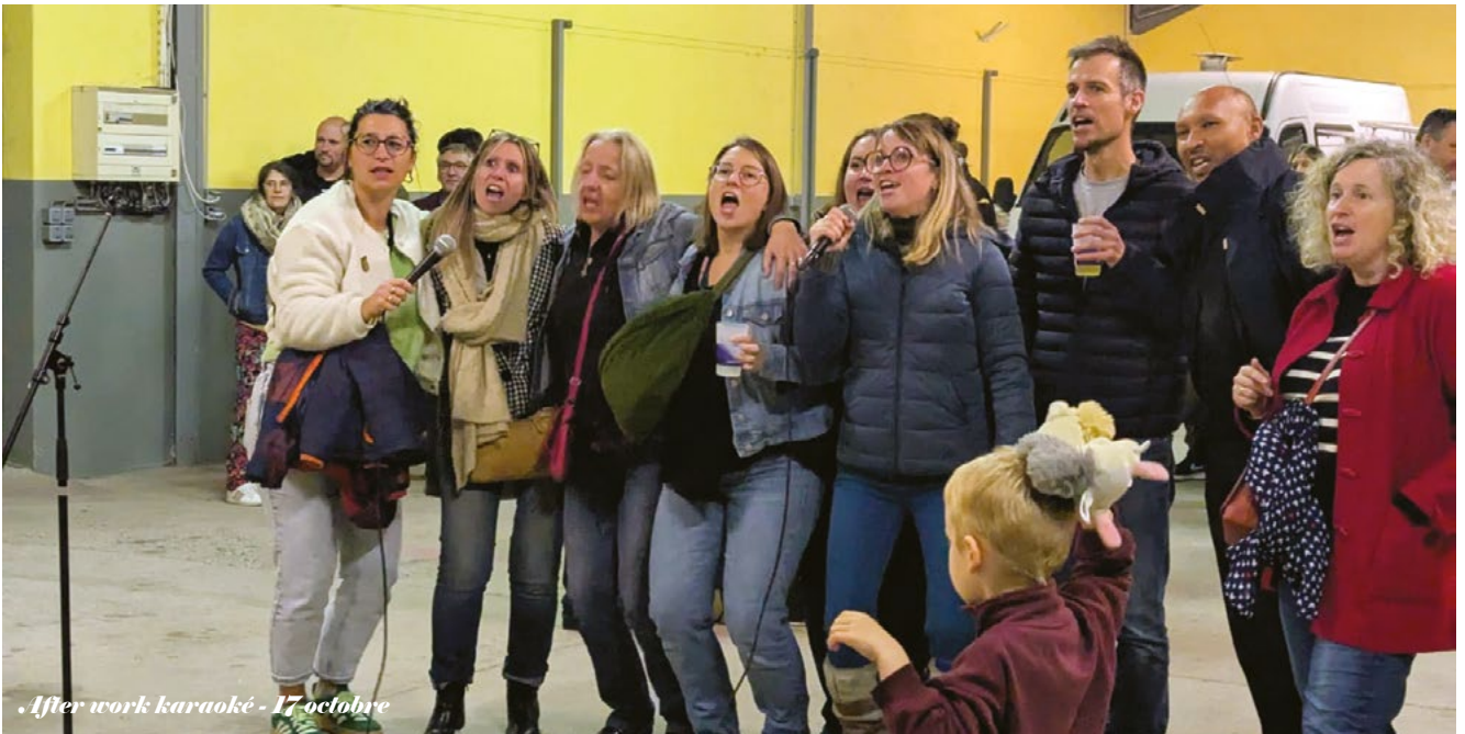
After work karaoké - 17 octobre