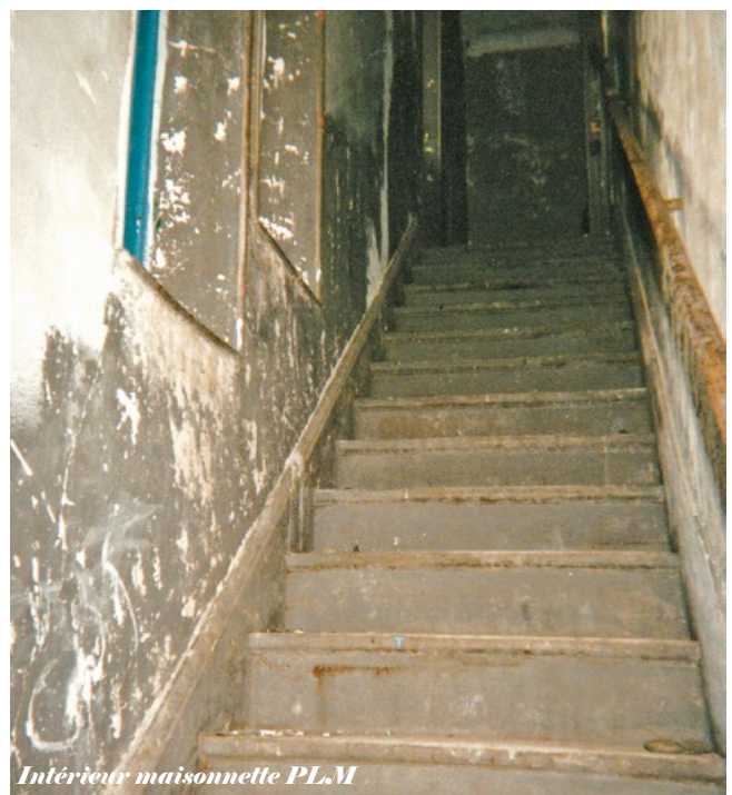
Intérieur maisonnelle PLM