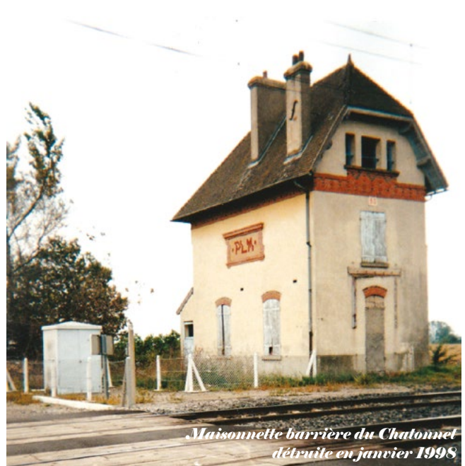
Maisonnelle barrière du Chatonnet détruite en janvier 1998