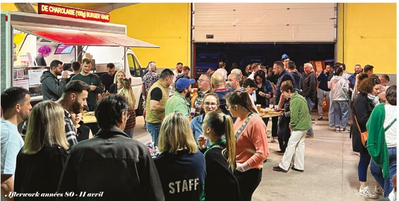
Afterwork années 80 - 11 avril