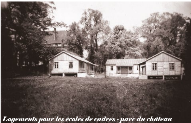
Logements pour les écoles de cadres - parc du château