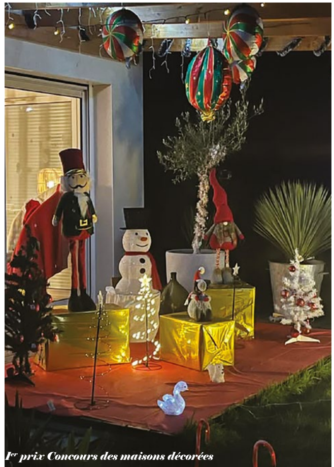
1 er prix Concours des maisons décorées